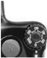
Bouton d'intensité de l'émetteur