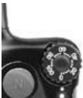
Intensity Selection Dial