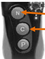
NICK button and CONSTANT button on the front of the transmitter